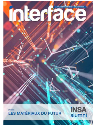
n° 148 3 ème trimestre 2023