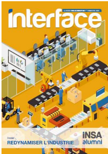
n° 146 1 er trimestre 2023